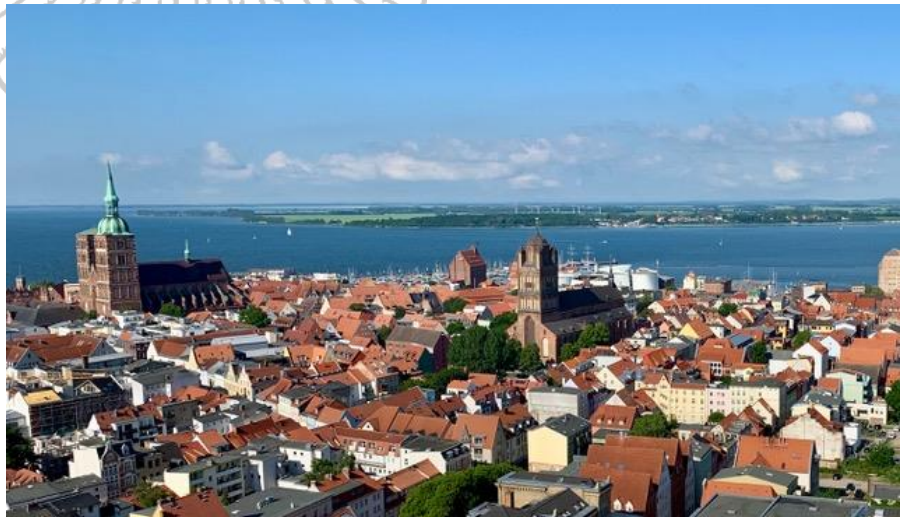
Blick über Stralsund von der St. Marien-Kirche

Dauer der Stadt-Pilger-Tour: ca. 4 Stunden (es gibt unterwegs Toiletten und Möglichkeiten zum Sitzen)